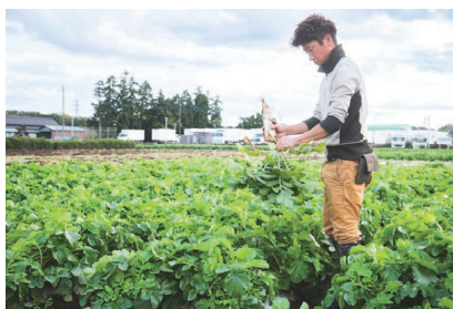
大根を栽培する畑は約4反。学校の体育館の2つ分くらいの広さです